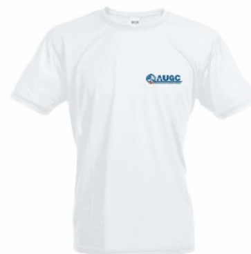
Camiseta técnica AUGC Tallas: S, M, L, XL, XXL