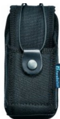
Porta walkie / sirdee universal

Visita la tienda y descubre más... tienda.augc.org