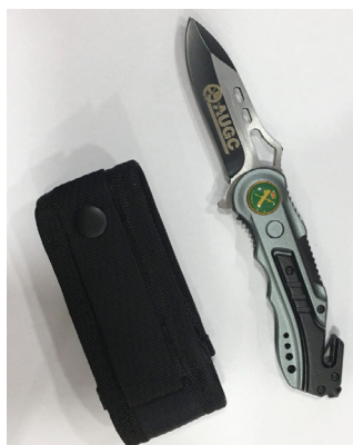
Navaja AUGC Fabricada por Albainox

Visita la tienda y descubre más... tienda.augc.org