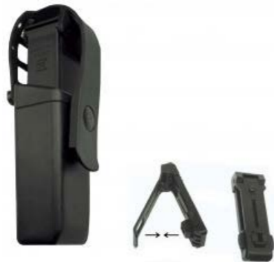
Portacargador universal MH-14S