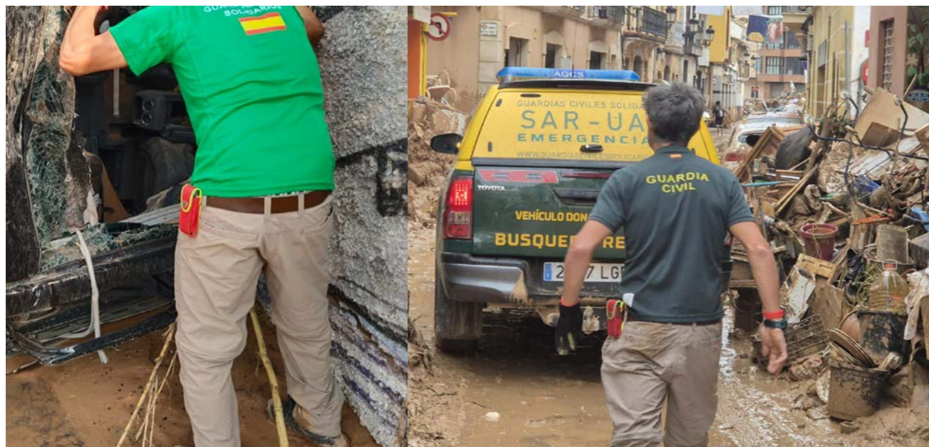
Enorme trabajo el que realizan nuestros compañeros de la Asociación "Guardias llevando material primera necesidad y auxiliando a afectados por la DANA