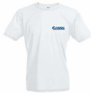
Camiseta técnica AUGC Tallas: S, M, L, XL, XXL