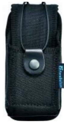
Porta walkie / sirdee universal