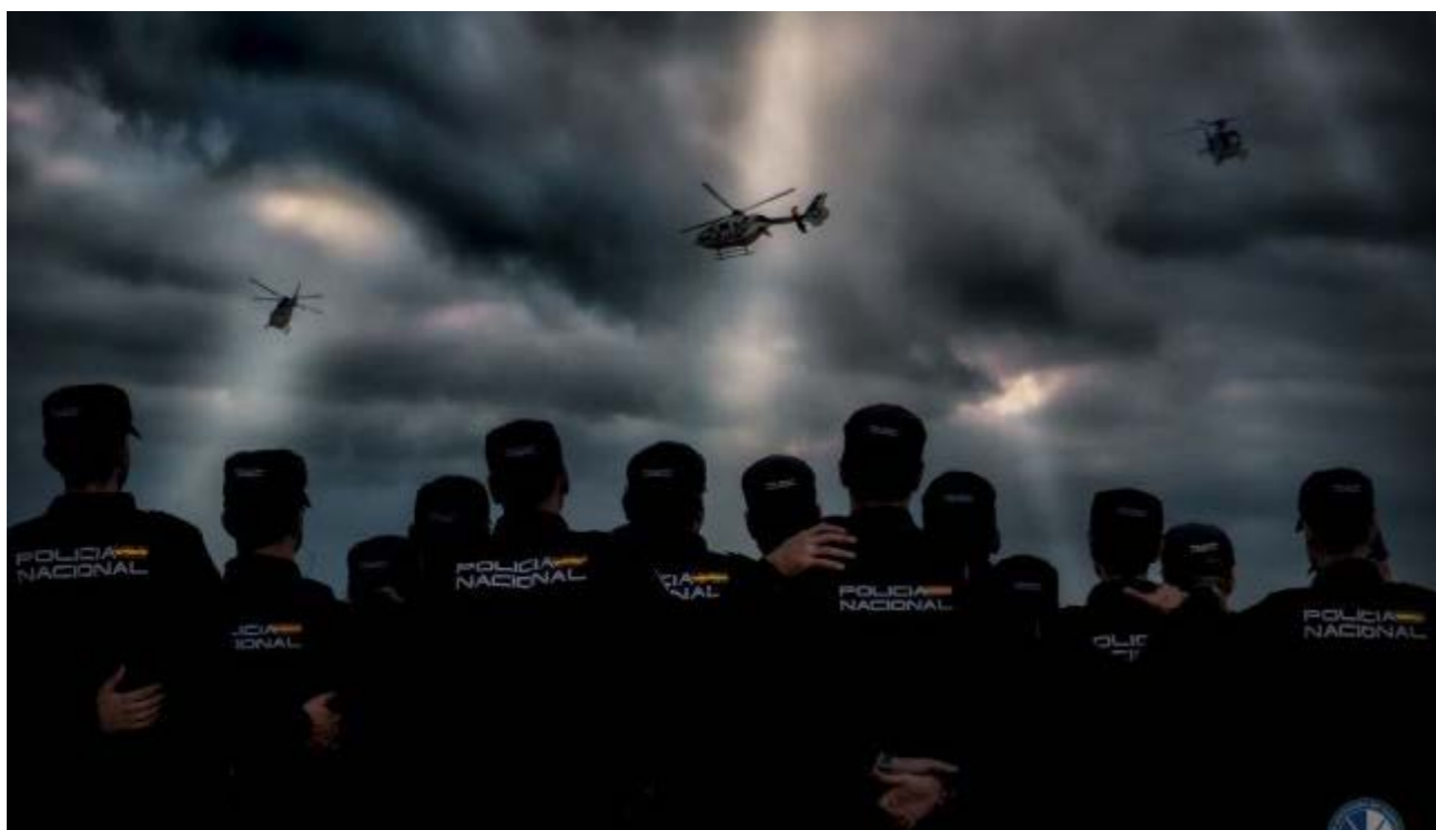
Segundo Premio: 'Compañeros' de Rubén Vázquez Trujillo.