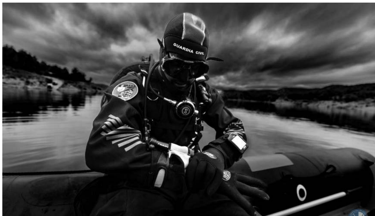
Fotografía ganadora X Certamen de Fotografía Eusebio García Flores. GEAS |Autor: Juan José Gómez Del Río