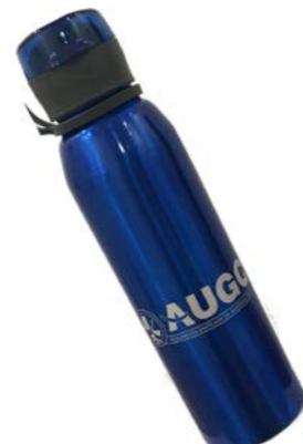
Botella AUGC 750 ml. De aluminio