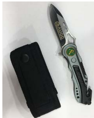
Navaja AUGC Fabricada por Albainox