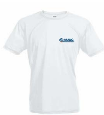
Camiseta técnica AUGC Tallas: S, M, L, XL, XXL