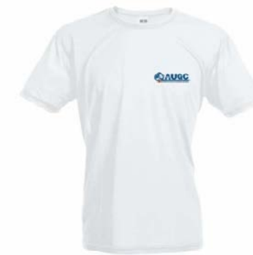
Camiseta técnica AUGC Tallas: S, M, L, XL, XXL