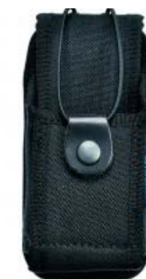
Porta walkie / sirdee universal