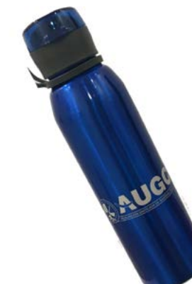
Botella AUGC 750 ml. De aluminio