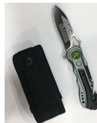
Navaja AUGC Fabricada por Albainox