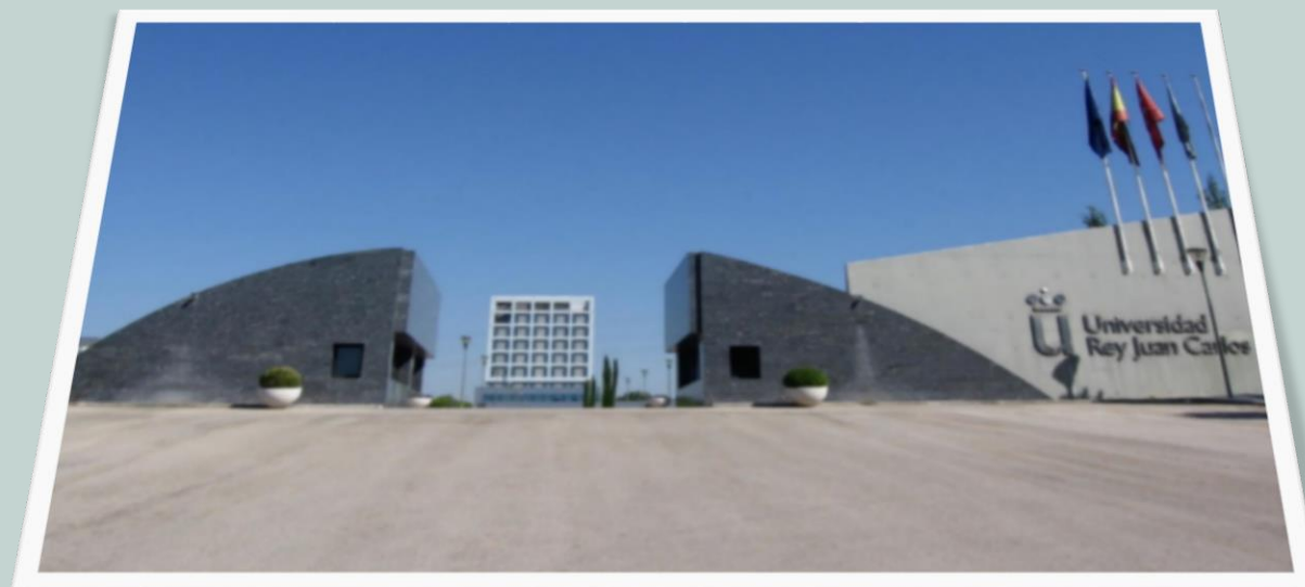
Campus de Móstoles de la URJC

La colaboración de la Escuela Europea de Ciencias de la Seguridad, con la Universidad Rey Juan Carlos se produce tras convenio suscrito en el año 2013, y siendo renovado en el año 2017 con la inclusión de titulaciones de Experto Universitario, Especialista Universitario y Máster, dentro de los programas formativos. Aúna la experiencia y amplia trayectoria del Patronato del Centro Universitario con el reconocido prestigio de la URJC, una de las seis universidades públicas de la Comunidad de Madrid. Su nombre es homenaje al Rey Juan Carlos I y fue creada